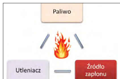
Rys. 1. Trójkąt spalania

Aby mogło dojść do pożaru muszą wystąpić trzy podstawowe elementy tzw.