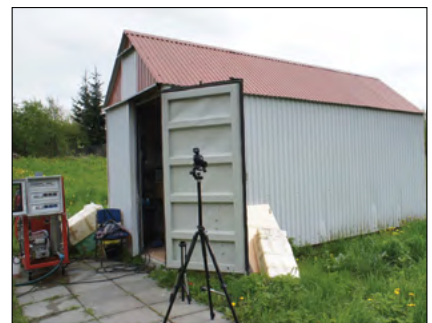
Fot. 1. Widok komory testowej z zewnątrz

Badanie zostało przeprowadzone w komorze testowej o wymiarach całkowitych L=6058 mm, S=2438 mm, Hw=2500 mm. Komora podzielona została na dwie części. W pierwszej znajdowała się aparatura sterująca, a druga część przeznaczona była do przeprowadzenia pożarów testowych. Mobilny zestaw pompowy wraz ze zbiornikiem na wodę o pojemności 200 l podczas testów znajdował się przed komorą testową. Część komory testowej przeznaczonej do testów pożarowych wyposażona była w niezależny system detekcji, wentylacji mechanicznej oraz system orurowania instalacji gaśniczej. W zależności od rodzaju instalacji montowany był odpowiedni rozpylacz. Rozpylacze zamontowane były na wysokości 2400 mm powyżej podłogi. Fotografie nr 1 i nr 2 przedstawiają widok komory testowej z zewnątrz oraz wewnątrz.