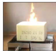
Fot.7. Próbka użyta do badań

ści 65 cm umieszczono na metalowych tacach. Za pomocą palnika gazowego podpalono blok z pianki poliuretanowej.