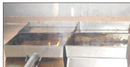
Fot.10. Test nr 1 w 8:30 min.