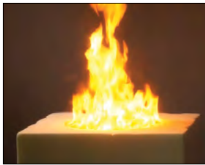
Fot.11. Test nr 2 w 1:35 min.