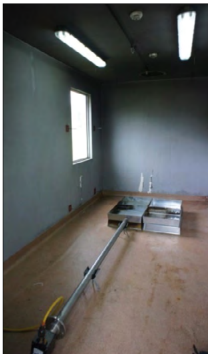
Fot.2. Widok komory testowej wewnątrz