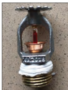
Fot.5. Tryskacz K80 użyty do badań

Do drugiego badania użyto otwartej dyszy mgłowej spiralnej DMS o następujących parametrach: