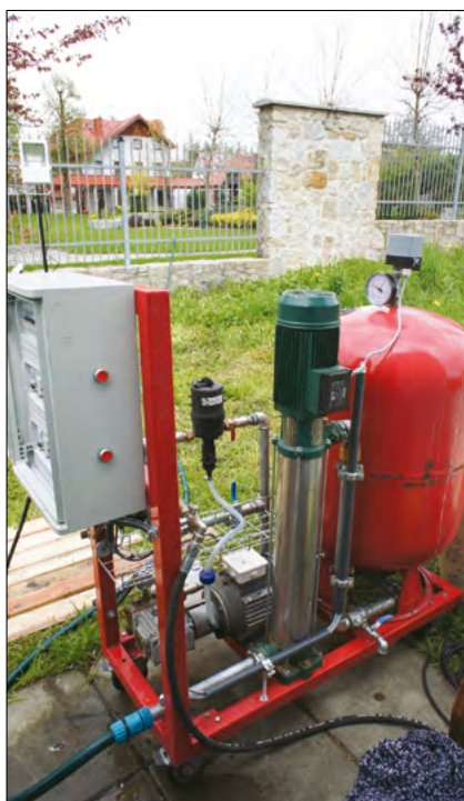
Fot.3. Zespół pompowy wraz ze zbiornikiem