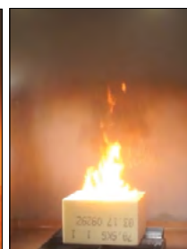
Fot.9. Test nr 1 w 6:15 min.