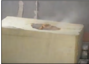
Fot.12. Test nr 2 w 1:42 min

Fotografia nr 11 przedstawia moment tuż przed uruchomieniem instalacji mgłowej. Pożar został ugaszony w 1:41 min. przeprowadzanego testu. Fotografia nr 12 przedstawia próbkę po ugaszeniu pożaru.