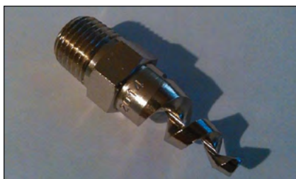
Fot.6. Dysza mgłowa spiralna DMS K3 użyta do badań

W obu badaniach użyto próbek o tych samych cechach. Blok pianki poliuretanowej o szerokości i wysokości 30 cm oraz długo-